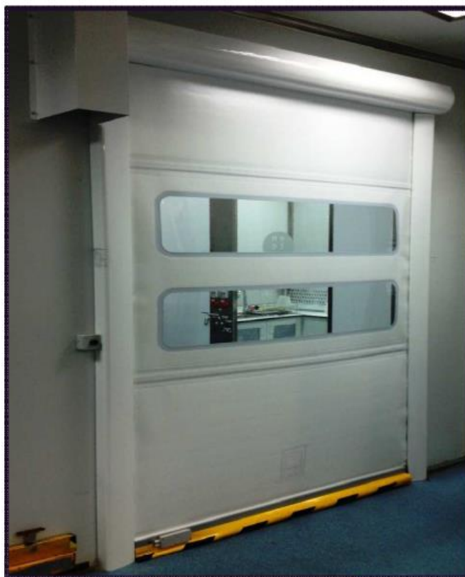
PUERTAS DE PASO

Nuestra puerta rápida CLEAN estructura de aluminio esmaltado en blanco RAL 9010 ó anodizado en plata (con tratamiento antihumedad), posibilidad de lacar otros colores, la mejor solución para salas blancas, laboratorios y zonas de ambiente controlado. Diseñada para soportar un gran tránsito fluido sin interferir a las personas , maquinaria, materiales.